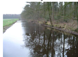
De Peelse Loop