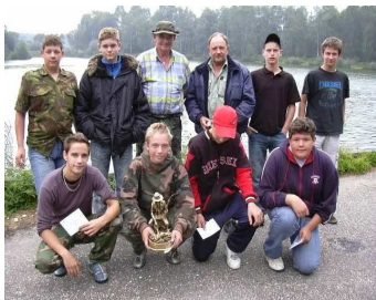
Deelnemers Karpervedstrijden 2006