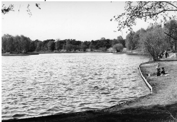
Oude Prentbriefkaarten van de Weth. Slitsvijver

De eerste 20 jaren zitten erop, van de twee hengelsportverenigingen HSV "De Aa-vissers" en HSV "De Rips", met het hele gebeuren bij het ontstaan en de problematiek rondom de Weth. Slitsvijver, heeft de Gemeente Bakel, Milheeze en De Rips nu eindelijk een grote HSV "De Middenpeel" met een mooie visvijver die door de fusie op 1 januari 1977 was ingegaan. Bij het verschijnen van een clubblad in onze HSV heeft er voor gezorgd, dat na een gemis van 10 jaar gebeurtenissen in onze HSV, de draad weer kunnen oppakken. Zodat we laatste 20 jaren van ons bestaan dankzij ons ontstane clubblad het gebeuren van onze HSV weer en tevens uitgebreider met enkele foto's kunnen samenvatten en beschrijven in het nu 50 jaar jubileum van HSV "De Middenpeel"