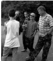
Instucties v.d. Organisator

De eerste 24 uur Karpervwedstrijd in onze HSV waarvoor de laatste twee weekenden van augustus 20/21 en 27/28 waren gereserveerd, hadden 9 karpervissers zich voor aangemeld, waarbij in gezamenlijk overleg was gekozen voor het weekend van 20/21 augustus. Jammer was het dat op het laatste moment er nog twee deelnemers zich hadden afgemeld.