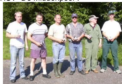
De prijswinnaars hengelsportdag 2006

Met het weer zat het goed vandaag en met de visvangst slecht, maar dat heeft gelukkig geen inbreuk gehad. Met andere woorden geen teniet gedaan op de manier en gezelligheid waarmee we deze hengelsportdag hebben mogen beleven. De jaarlijkse hengelsportdag op deze wijze te vieren, is en blijft, nu al na twee keer te zijn gehouden, een hoogtepunt in onze HSV "De Middenpeel".